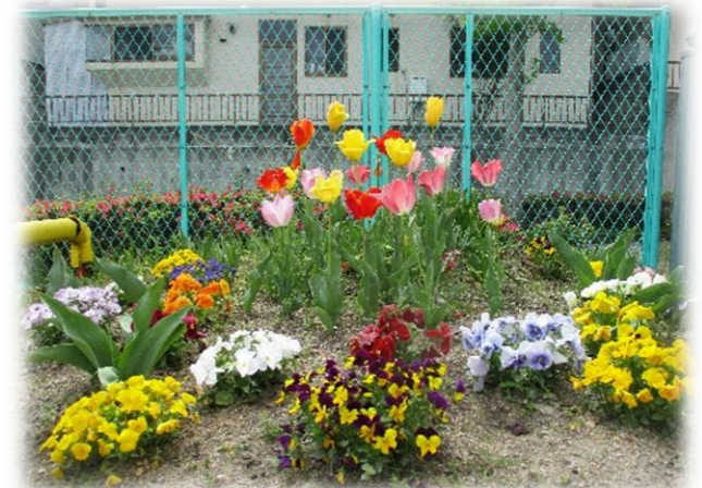
下の庭の花壇のお花がきれいに咲きました！